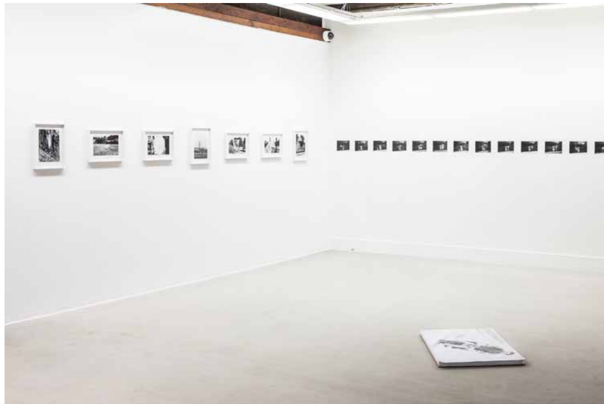
Ballons, Briefkästen, Mopedfahrer in der Ausstellung / installation view Hundewege. Index eines konspirativen Alltags , 2013, Kunsthalle Erfurt