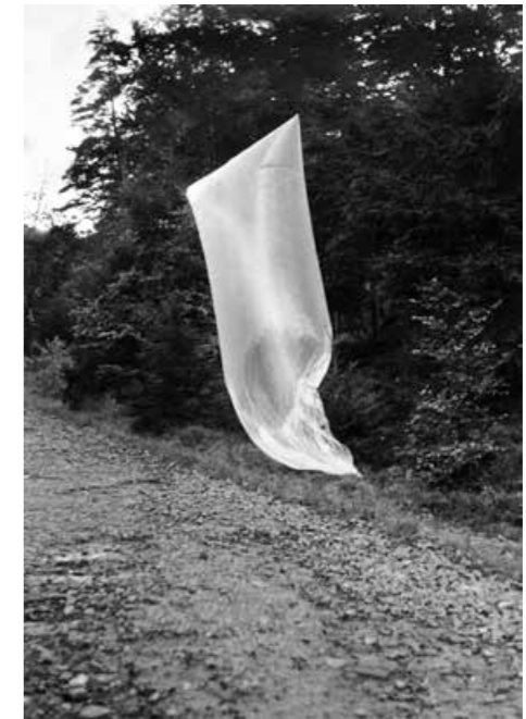
Zella-Mehlis, 27. 9. 1963, Wind WNW 35 km/h