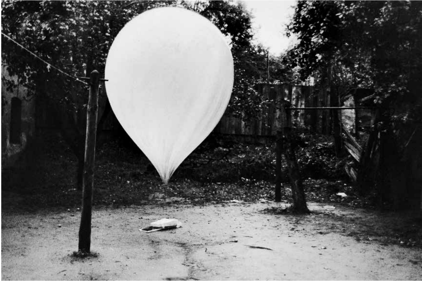
Karl-Marx-Stadt, 11.8.1969, Wind SSW 12 km/h