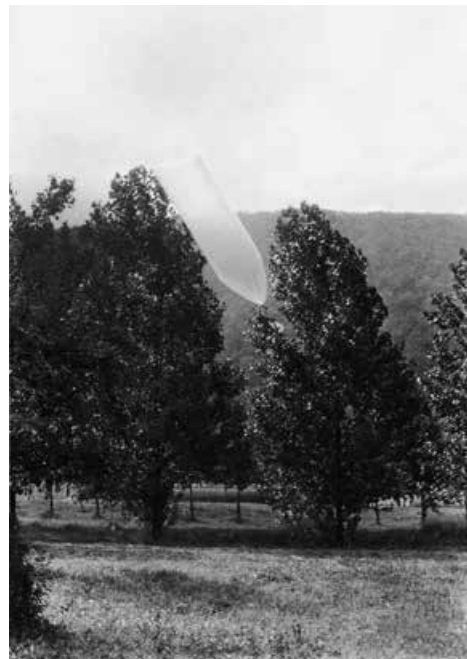
Werraufer bei Falken, 12. 7. 1963, Wind W 28 km/h