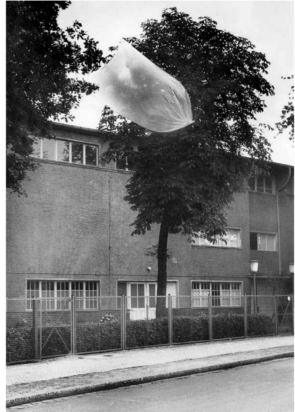
Berlin-Grünau, Regattastraße, 27.7.1966, Wind SW 18 km/h