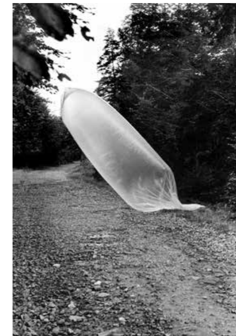
Zella-Mehlis, 27. 9. 1963, Wind WNW 35 km/h