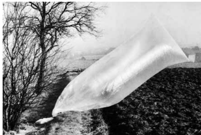
Krölpa, 26. 2. 1964, Wind SO 15 km/h