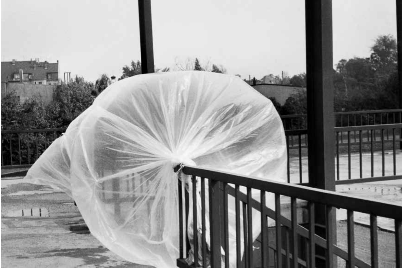
Leipzig, technische Messe, 13. 9. 1966, Wind W 20 km/h