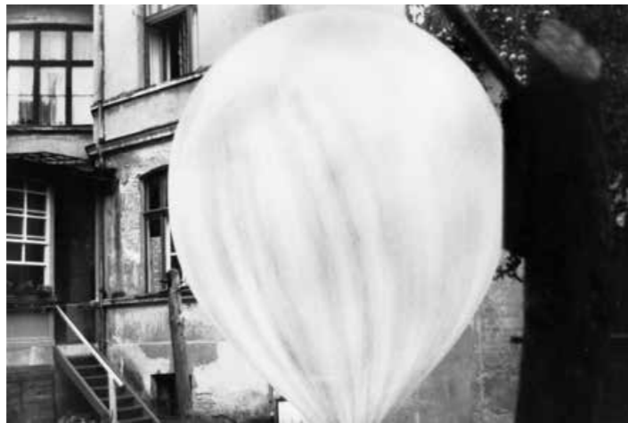
Schwerin, 29. 8. 1962, Wind NNW 12 km/h