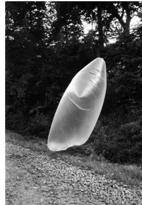
Zella-Mehlis, 27. 9. 1963, Wind WNW 35 km/h