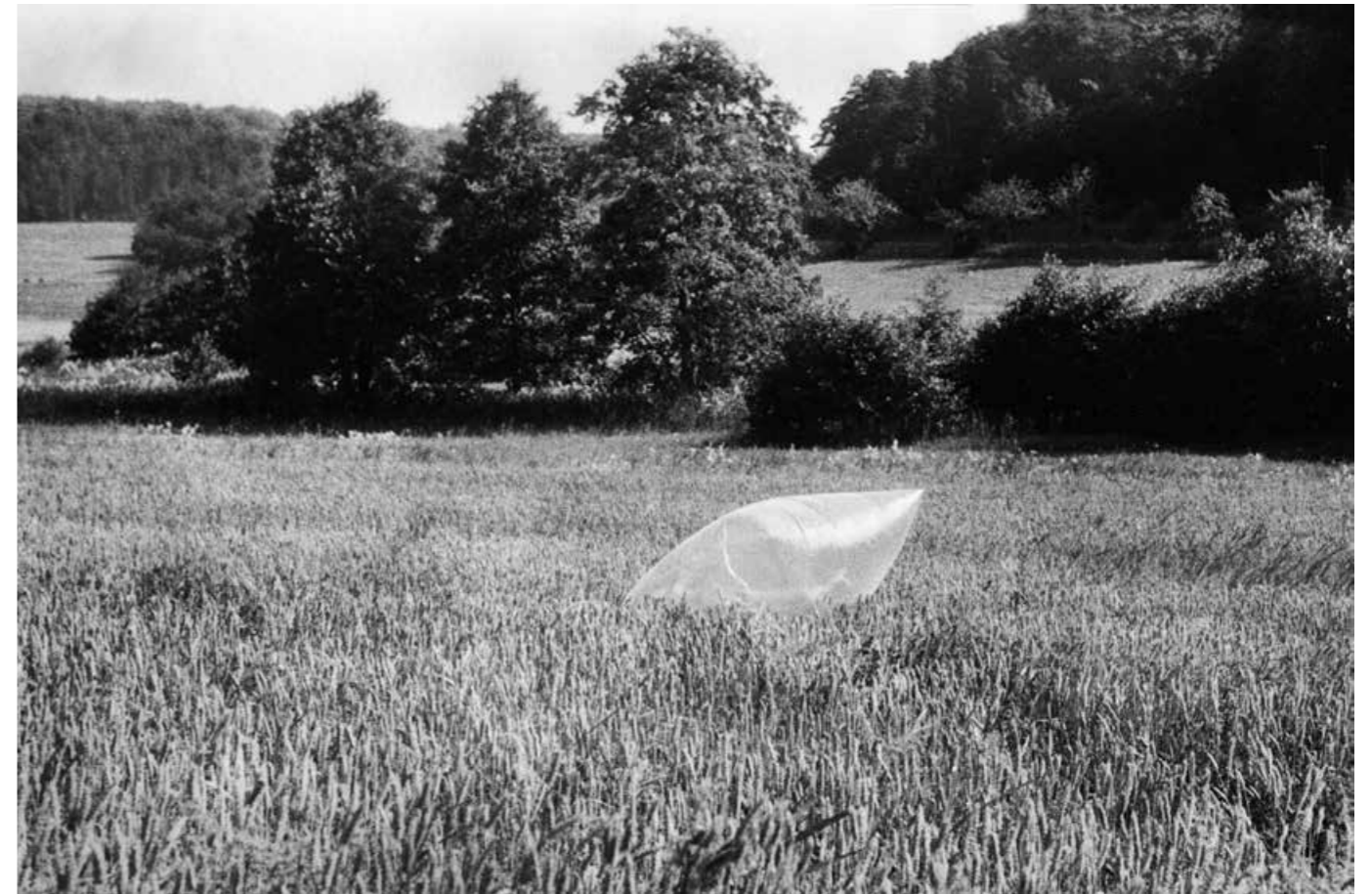
Weizenfeld bei Ifta, 26. 7. 1963, Wind N 20 km/h