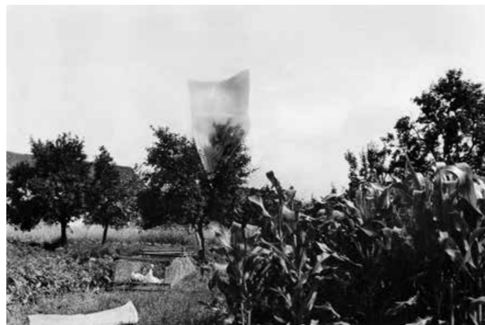
Parchen bei Genthin, 27. 7. 1966, Wind SW 17 km/h