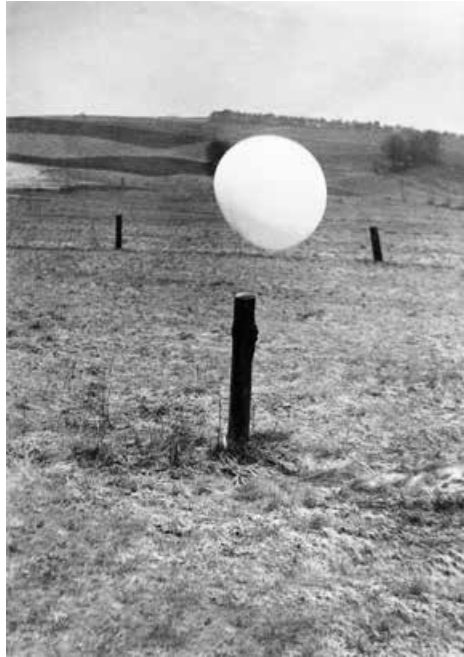
Oberellen bei Eisenach, 13. 12. 1962, Wind W 10 km/h