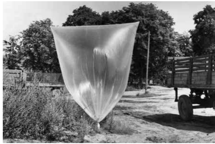
Glindenberg bei Wolmirstedt, 28. 7. 1966, Wind WSW 18 km/h