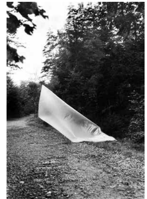
Zella-Mehlis, 27. 9. 1963, Wind WNW 35 km/h