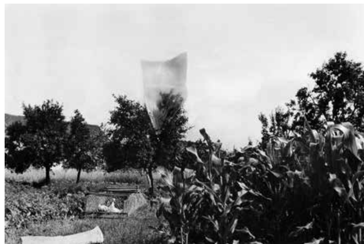
Parchen bei Genthin, 27. 7. 1966, Wind SW 17 km/h