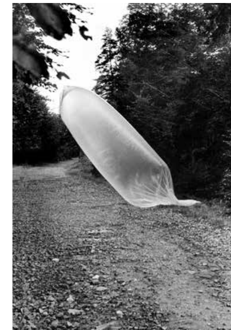
Zella-Mehlis, 27. 9. 1963, Wind WNW 35 km/h