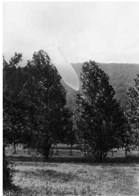
Werraufer bei Falken, 12. 7. 1963, Wind W 28 km/h