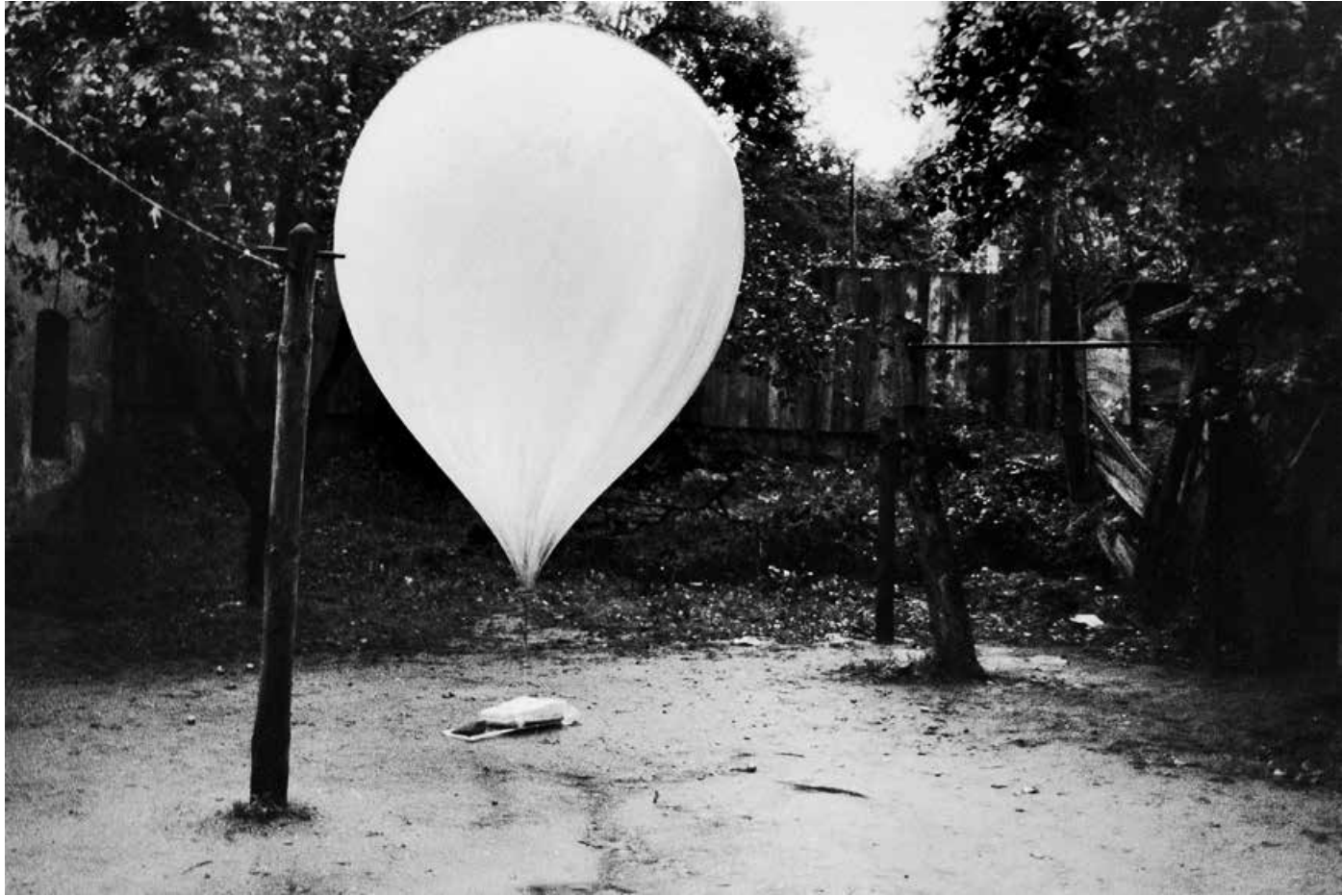
Karl-Marx-Stadt, 11.8.1969, Wind SSW 12 km/h