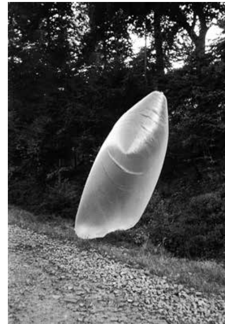
Zella-Mehlis, 27. 9. 1963, Wind WNW 35 km/h