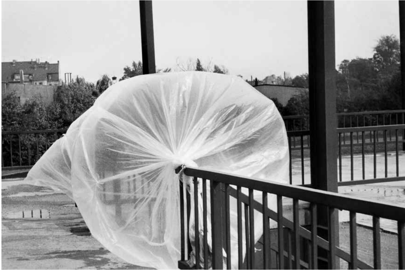
Leipzig, technische Messe, 13. 9. 1966, Wind W 20 km/h