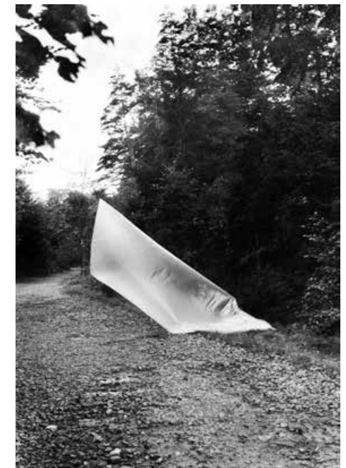
Zella-Mehlis, 27. 9. 1963, Wind WNW 35 km/h