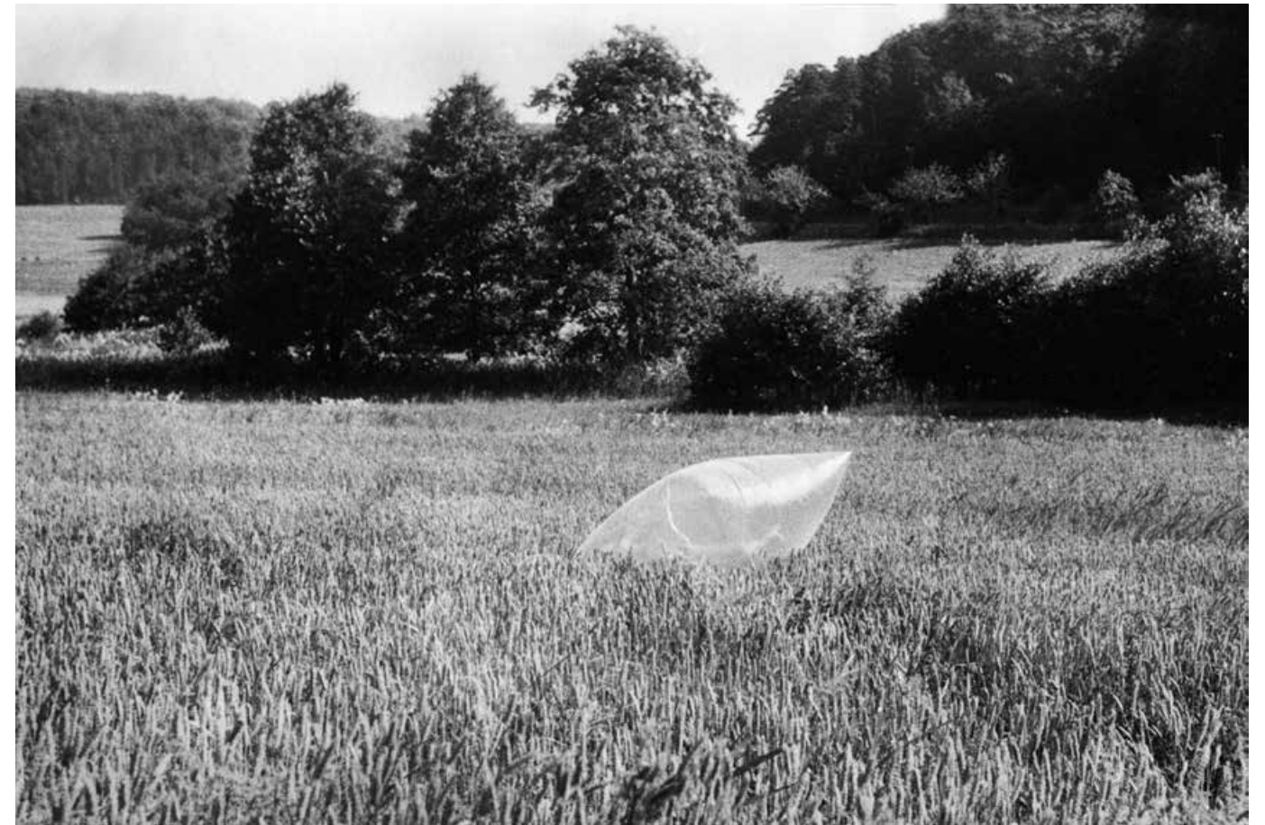
Weizenfeld bei Ifta, 26. 7. 1963, Wind N 20 km/h