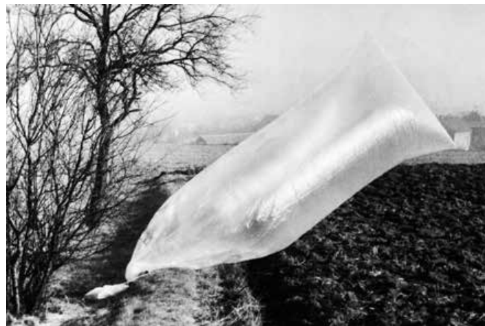
Krölpa, 26. 2. 1964, Wind SO 15 km/h