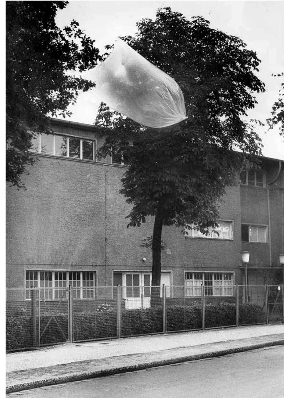
Berlin-Grünau, Regattastraße, 27.7.1966, Wind SW 18 km/h