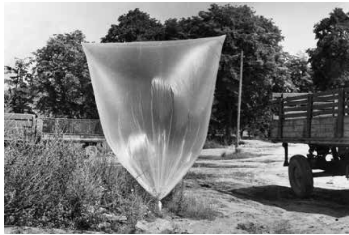
Glindenberg bei Wolmirstedt, 28. 7. 1966, Wind WSW 18 km/h