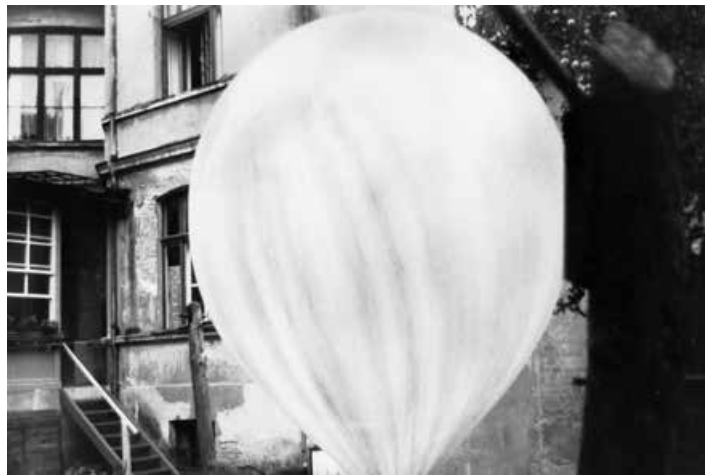
Schwerin, 29. 8. 1962, Wind NNW 12 km/h