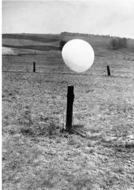
Oberellen bei Eisenach, 13. 12. 1962, Wind W 10 km/h