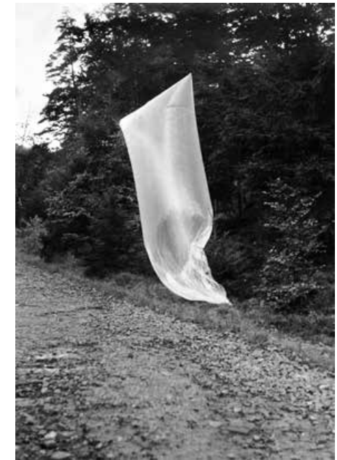
Zella-Mehlis, 27. 9. 1963, Wind WNW 35 km/h